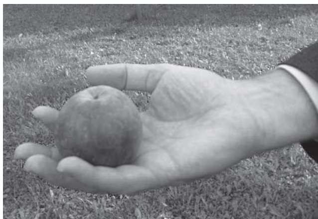
“Tekmujte v medsebojnem spoštovanju.” (Rim 12,10)

Uvodoma je bilo predstavljeno življenje v mestu nekoč in danes. Evangelizirati je potrebno mesta , saj v sodobnem