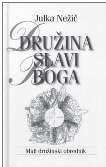
Naslovnica novega obrednika.

Da bo čim več družin slavilo Boga tudi s pomočjo predstavljene knjige, Vam