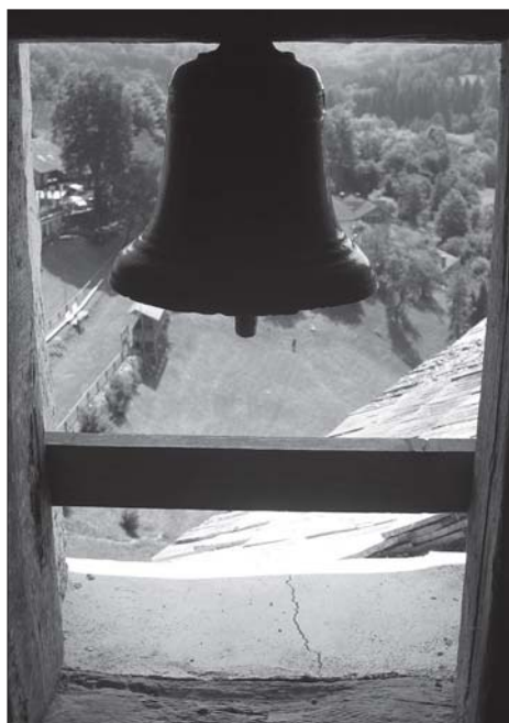
“Oznanjajte na strehah.” (Mt 10,27)

skupaj s škofi in duhovniki pod geslom Za življenje – za družino . To naj bo zahvala za vse dobro v preteklih letih in prošnja za Božji blagoslov v prihodnjih letih. Ker pričakujemo veliko množico vernikov iz