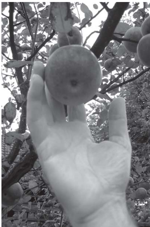
“Kdo bi spoznal Tvojo voljo ...” (Mdr 9,17)

Ad 9. Prihodnja seja plenuma ŠPS bo predvidoma v soboto, 16. februarja 2008, ob 9.30 uri v Repnjah. ■