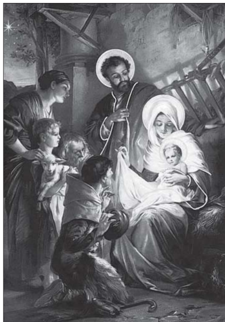
“... in se naselila med nami.” (Jn 1,14)

ti Sveto pismo zares pomeni vzeti resno lastno misijonsko poslanstvo v okolju, v katerem živimo. O tem je pogosto govoril papež Janez Pavel II., ki je opozoril, da je Cerkev povsod – tudi pri nas in v Evropi – misijonska. Poslanstvo oznanjevanja z besedo in dejanji tako zelo sodi k njeni naravi, da si nikjer, tudi v deželah z utrjeno krščansko tradicijo, ne more dovoliti, da ne bi bila misijonska. Pastoralni delavec je torej misijonar. Ta duh je toliko bolj lasten duhovniku, ki verne zna usmerjati in spodbujati k pričevanjskemu krščanstvu. Najučinkovitejši misijonarji, vsaj v odno-