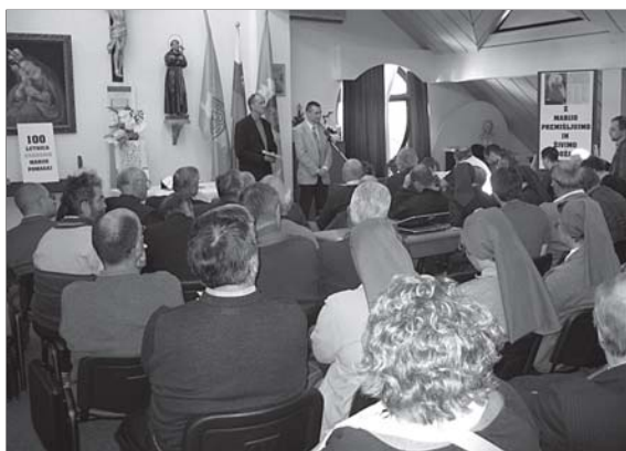
Predavanje na Pastoralnem tečaju na Brezjah.

Največjo težavo predstavlja zaprtost, saj družinski člani o težavah v svojem okolju ne želijo govoriti. V oznanilih in na oglasni deski naj bodo objavljeni kontaktni podatki ustanov in centrov, ki nudijo strokovno pomoč.