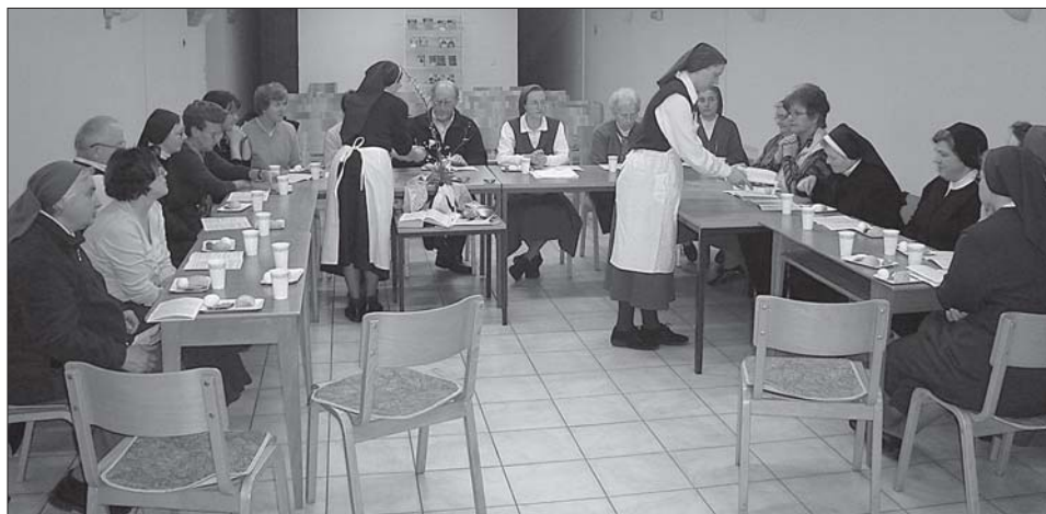
Obhajanje obreda pashalne večerje na srečanju katehistov.

Prosim, da informacijo o naših srečanjih posredujete vsem, ki zanjo še ne vedo. Glede podrobnosti pa lahko pokličete (tel.: 04/515-16-28) ali pišete na e-pošto: anka.kogelnik@rkc.si . ■