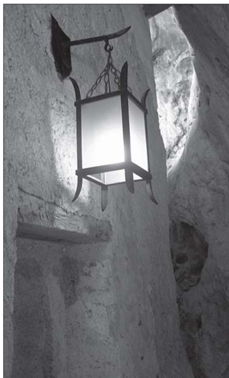
„... in sveti vsem, ki so v hiši.“ (Mt 5,15)

Nekateri menijo, da se starši sčasoma navadijo živeti v izvenzakonski skupnosti, izgovarjajo pa se na različne načine, npr. na prevelike denarne izdatke, obrede itd. Psihologi opozarjajo , da ti pari