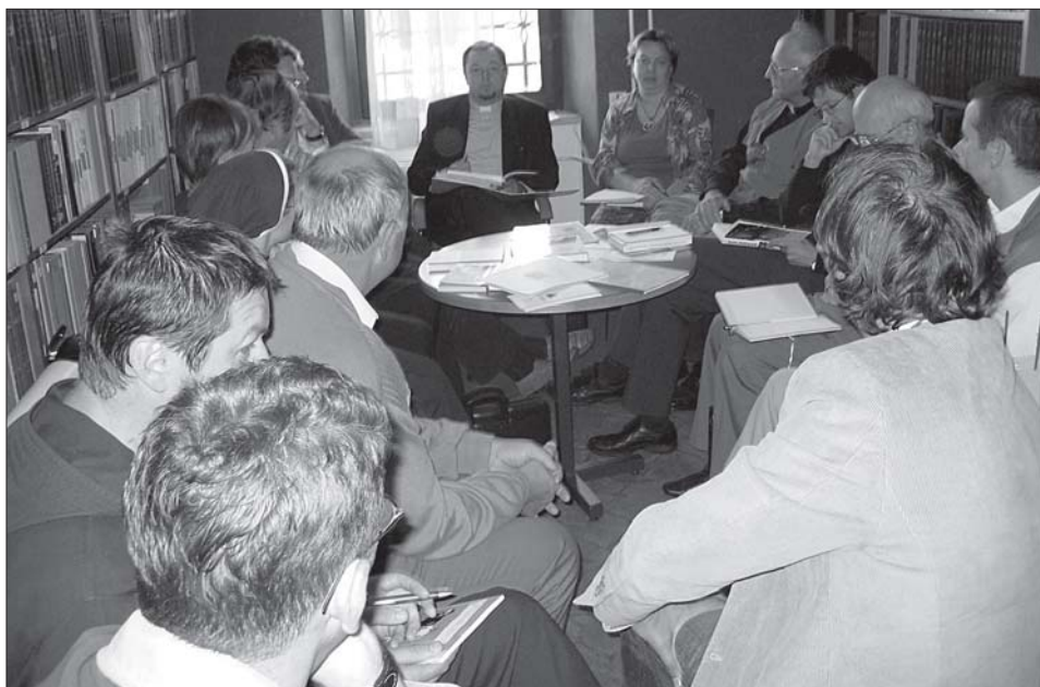
Delo po skupinah na Pastoralnem tečaju na Brezjah.

Kljub mnogim vprašanjem je pomembno, da se o problematiki pogovarjamo, da zaupamo v Božjo ljubezen in sledimo Jezusovemu nauku, da smo vsi njegovi ljubljene otroci in da posebno skrb potrebujejo ravno ljudje v stiski. ■