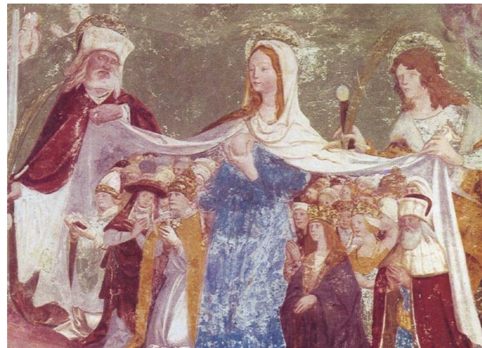
Slika: Freska, 1504, Sv. Primož nad Kamnikom

Da je danes sodelovanje vernikov v življenju župnijske skupnosti eno