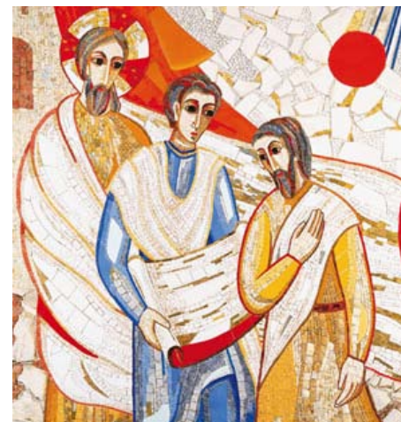
Slika: Kristus z emavškima učencema, 2003

Znan je pregovor: »Po duhovnikih vera gor, po duhovnikih vera dol.« Modeli občestvene prenove župnije po drugem vaticanskem koncilu zahtevajo spremenjeno vlogo duhovnika v občestvu. S tem namenom v nadaljevanju povzemamo nekaj najpogostejše pričakovanih lastnosti duhovnika danes.