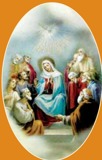
..., ki je Svetega Duha poslal!