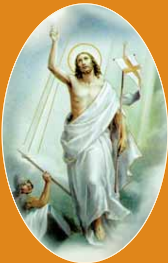
..., ki je od mrtvih vstal!

Častitljivi del rožnega venca opisuje dogodke, ki so se zgodili po velikem petku.