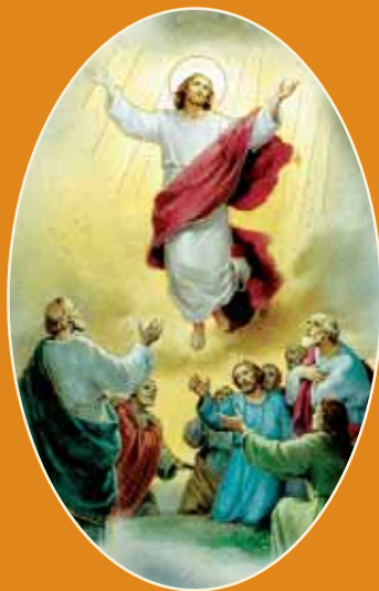
..., ki je v nebesa šel!