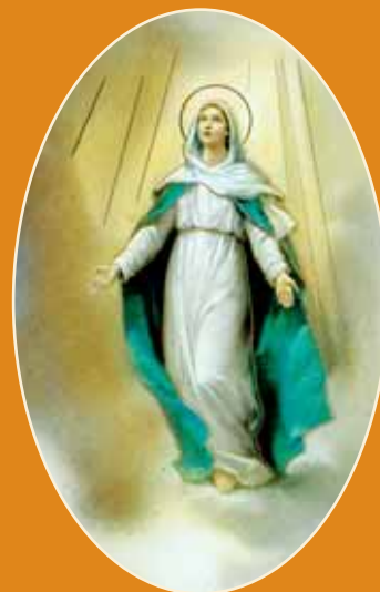
..., ki je tebe, Devica, v nebesa vzel!