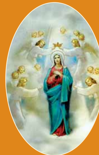
..., ki je tebe, Devica, v nebesih kronal!