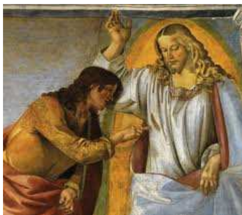
Neverni Tomaž in Jezus

51. Čeprav ima umsko oblikovanje svojo značilnost, je tesno povezano s človeškim in duhovnim oblikovanjem kot njen potreben izraz: predstavlja se kot nujna zahteva razumnosti, s katero je človek »deležen luči božjega uma« (CS 15) in skuša pridobiti modrost, ki se s svoje strani odpira in usmerja v spoznanje Boga in povezavo z njim.