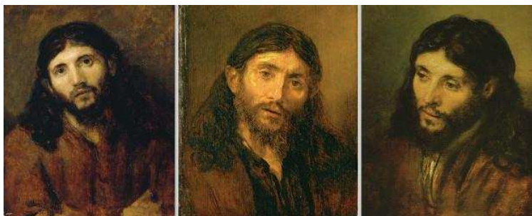
Jezusov obraz, Rembrandt

45. Če se človeško oblikovanje razvija v povezavi z antropologijo, ki sprejema vso resnico o človeku, se odpira in dopolnjuje v duhovnem oblikovanju. Vsak človek, ustvarjen od Boga in odrešen s Kristusovo krvjo, je poklican v