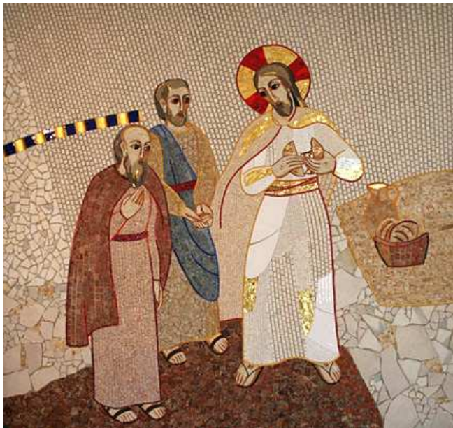
Centro Alletti, Emavs: Razlomljeni kruh, Madrid (2005)

Duhovnikovo oblikovanje je v svoji duhovni razsežnosti zahteva novega in evangeljskega življenja, h kateremu je na poseben način poklican od Svetega Duha, podeljenega v zakramentu svetega reda. Sveti Duh posveti duhovnika in ga upodobi po Jezusu Kristusu, Glavi in Pastirju ter ustvarja z njim povezavo, ki sega v samo njegovo bistvo kot duhovnika. To pa zahteva, da duhovnik to povezanost asimilira in jo živi na osebni način. Zavestno in svobodno naj bi po občestvu življenja in ljubezni vedno bolj bogato in vedno globlje in močnejše sodoživljal čustva in